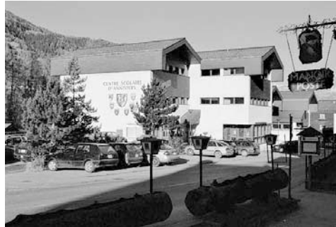
Etablissement du centre scolaire à Vissoie

Die Qualität der Mittagessen ist sehr wichtig. Die Menus bestehen aus Salat, Hauptgang und Dessert und sind kindergerecht zubereitet. Dazu gibt es Getränke nach Wahl (Sirup, Tee, Wasser, Orangensaft). Die Eltern werden im Voraus über die Menupläne informiert. Täglich werden rund 200 Essen ausgegeben.